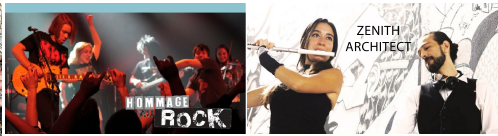
HOMMAGE AU ROCK